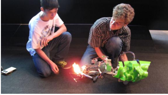
Abbildung 6: Er kann richtig Feuer speien, der Drachen der beiden Jugendlichen. Hier bei einer Vorführung anlässlich der Ars Electronica 2009 mit dem Betreuer der beiden (rechts).

Das sind einige recht unterschiedliche Beispiele für Laien als Erfinder. Zusammengefasst könnte man folgendes sagen: Eine arbeitsteilige Gesellschaft, wie sie sich spätestens seit der frühen Neuzeit immer weiter ausdifferenziert hat, delegiert das Erfinden und Entwickeln gerne an Spezialisten der verschiedenen Fachgebiete. Diese schirmen sich mit mehr oder weniger Erfolg gegen Eindringlinge von aussen ab. Laien als Erfinder und Entdecker überleben aber in speziellen Nischen gerade auch dann, wenn sie hiermit nicht ihr Brot verdienen müssen. Besonders interessant für sie ist das Grenzgebiet zwischen Kunst und Wissenschaft.