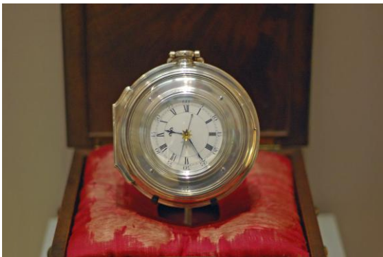
Abbildung 1: Der Marinechronometer H5 von 1772 des britischen Tischlers John Harrison. Sie war das genaueste Modell, das Harrison entwickelte hatte. Dass er mit seinen immer genauer werdenden Uhren das so genannte Längengradproblem löste, wurde von der Fachwelt erst zögerlich anerkannt.

Als sich der Tischler John Harrison (1693-1776) zu Beginn des 18. Jahrhunderts in London der Herausforderung stellte, das Problem der Längengrad-Bestimmung zu lösen, tat er dies als Laie. Weder verstand er sich auf die Astronomie, von der die damalige gelehrte Welt die Lösung erwartete, noch konnte er sich Uhrmacher nennen. Wie dringend das Längenproblem einer Lösung harpte, zeigte allein die Preissumme, die das britische Parlament ausgelobt hatte: 20 000 Pfund. Nach heutigen Begriffen ein Betrag von mehreren Millionen Euro! – Konnte man in der frühen Neuzeit den Breitengrad relativ einfach bestimmen, so war die Ermittlung des Längengrads auf hoher See nicht möglich. Das behinderte die Entwicklung der Seefahrt und führte zu riesigen Zeitverlusten.