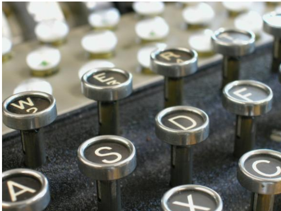
Abbildung 2: Detail der legendären deutschen Chiffriermaschine Enigma. Unser Bild zeigt die Tasten, die jenen einer Schreibmaschine ähneln.

Sternwarte Eschenberg 2 hat eine eindrückliche Liste von Asteroiden beobachtet und entdeckt. In der Astronomie haben Entdecker das Recht Asteroiden einen Namen zu geben: Winterthur, Helvetia, Wiesendangen heissen einige der von ihm entdeckten Kleinplaneten. Das Phänomen der Amateurastronomie ist immerhin genügend bedeutsam, dass es dazu ein Stichwort in der Wikipedia gibt. 3